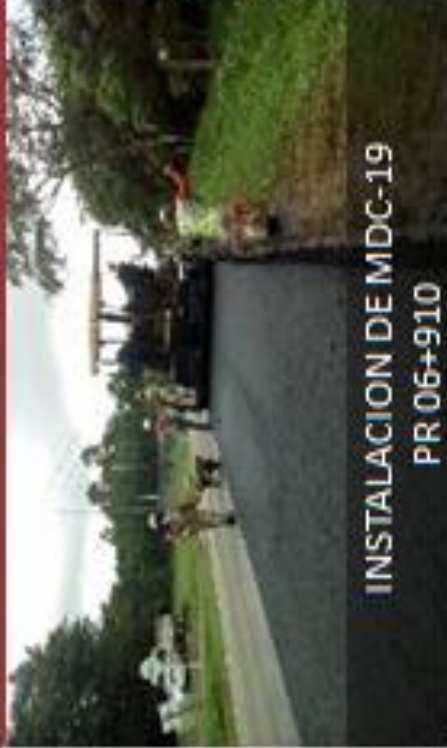
INSTALACION DE MDC-19 PR 06+910