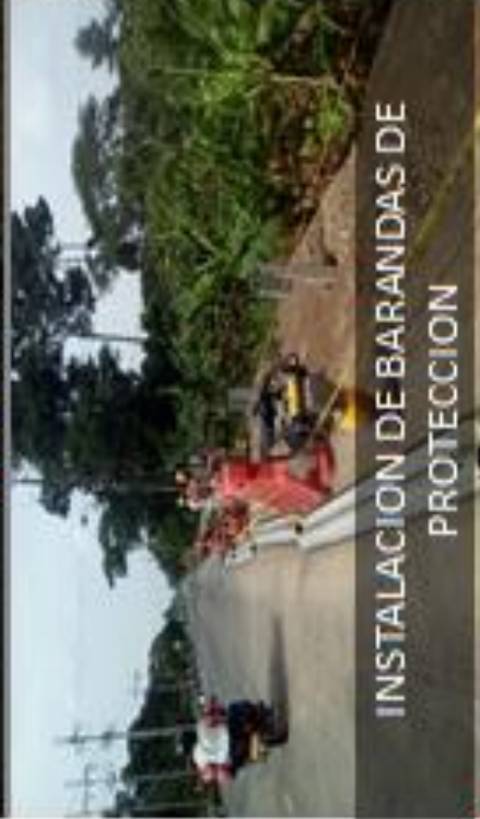
INSTALACION DE BARANDAS DE PROTECCION