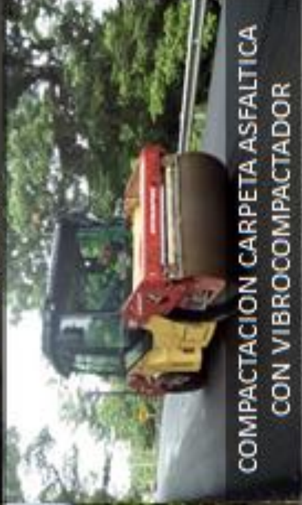
COMPACTACION CARPETA ASFALTICA CON VIBROCOMPACTADOR