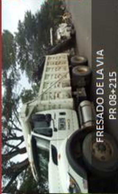
FRESADO DE LA VIA PR 08+215